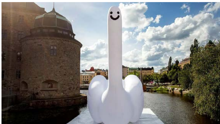
David Shrigley, ”Swan Thing”, vid Slottet i Örebro.

Artipelag vid Baggensfjärden rymmer konst, design, scenkonst, mat – därtill skulpturer och ”skogsbad” utomhus i skönaste skärgårdsnatur. Världsnamnet Anselm Kiefer fyller nu konsthallen, vilket dessvärre dubblar inträdet . Men för dem som har råd väntar en mäktig konstupplevelse, med Kiefers monumentala målningar och skulpturer i känsligt samspel med naturen utanför fönstren. Konstnären inkorporerar material som aska, bly och växtdelar i sina verk, vilket en film i källaren fint demonstrerar.