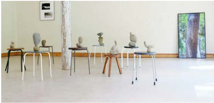
Vy från Magnus Thierfelder Tzotzis utställning på Elastic rural i Jädraås, Gästrikland.