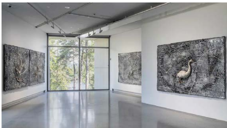
Vy från Anselm Kiefers utställning på Artipelag i Värmdö kommun.