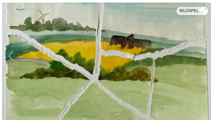
Bild 1 av 2 "Broken landscape" av den ukrainska konstnären Kinder Album (pseudonym) på Rikstolvan.

Skulpturparken på Wanås gods har stadigt växt ända sedan 1987. I dag är Wanås ett betydande utflyktsmål, med konst, kossor, mat och hotell i fin förening. Godsets ekoprofi stärks nu av utställningsverksamheten i slottsparken och gamla magasin. Den danske konstnären Peter Linde Busk arbetar med återbruk och har experimenterat fram en hållbar pappersmassa till sin sagolika utomhusskulptur, medan designkollektivet Numen/ for use utvecklat en biologiskt nedbrytbar tejp till sin sällsamma installation.