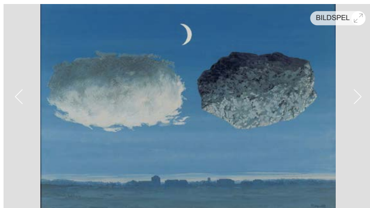
Bild 1 av 2 René Magritte, "La bataille de l'Argonne", gouache 1964, visas på Akvarellmuseet i Skärhamn