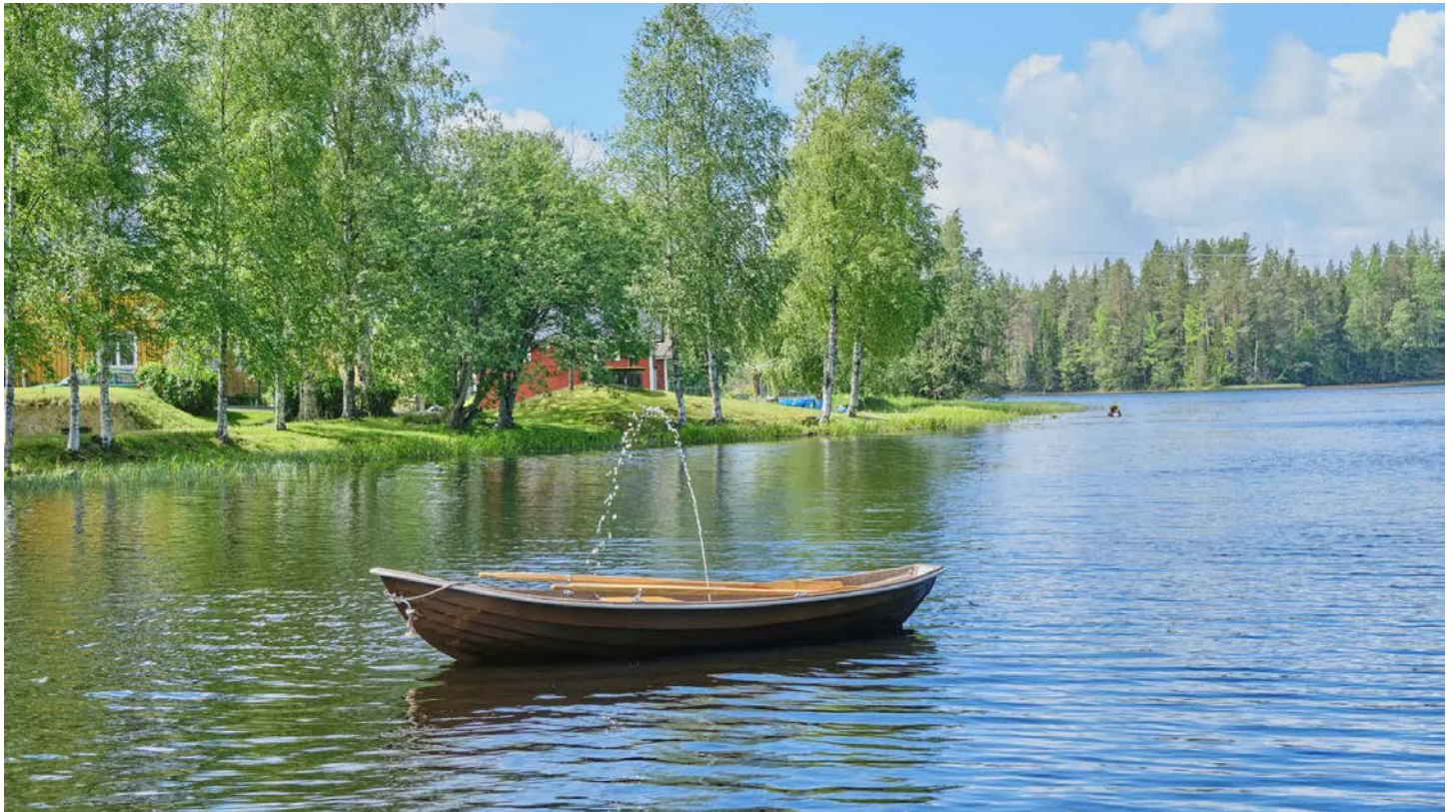
Magnus Thierfelder Tzotzis, "En fjärils vingslag", i Jädraån i Gästrikland.

UPPDATERAD 2022-07-03 PUBLICERAD 2022-07-03