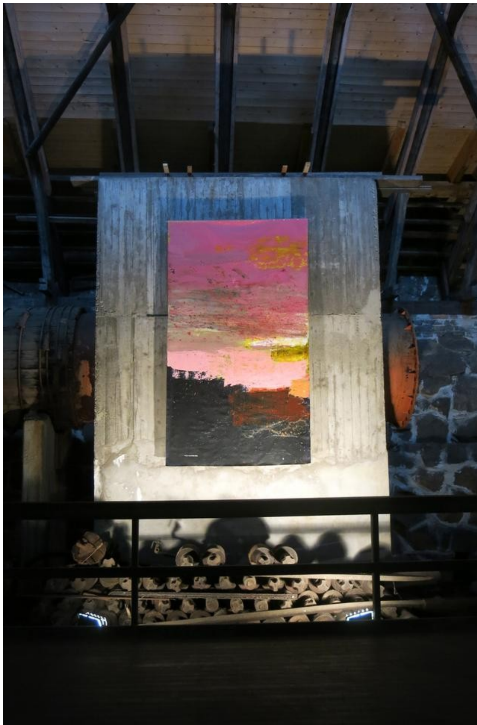
"Skymningstid" av Malin Wikström.

Den rosa färgen återkommer i flera av de stora målningarna som finns utplacerade runt om i Valsverket. I mörkret och den instängda kylan så lyser de som rosa solar. Det är ett abstrakt måleri med mycket struktur, och även om uttrycket är abstrakt så kan jag inte låta bli att läsa in Valsverkets miljö i ett par av målningarna som ser ut att ha smält metall rinnande över sig.